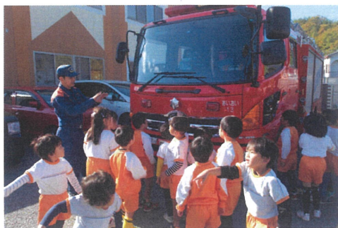
消防車、かっこいい～！！