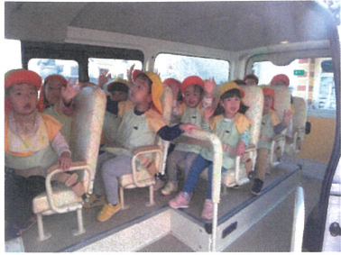
2. 消防車ぬりえ体験