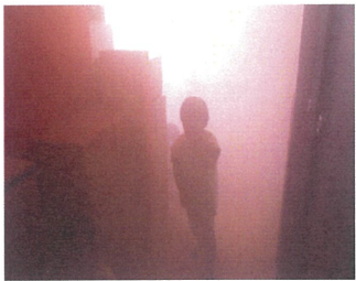
3. けむり体験 こわかったー